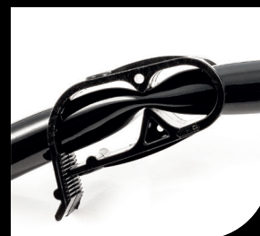
Pinza schiaccia tubo "Squeeze tube clamp"