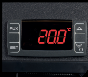
Termostato / Thermostat